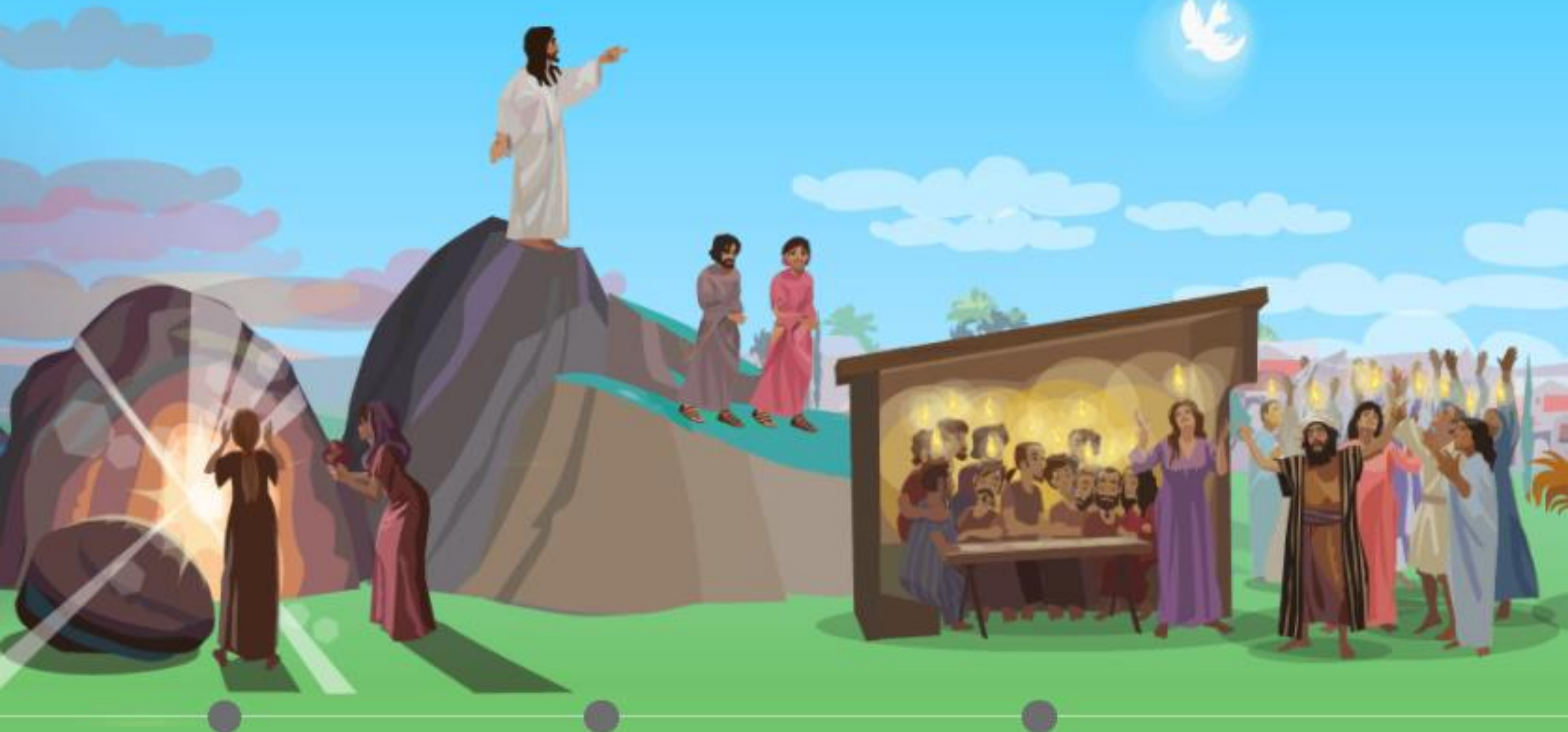
Kvinnene ved graven